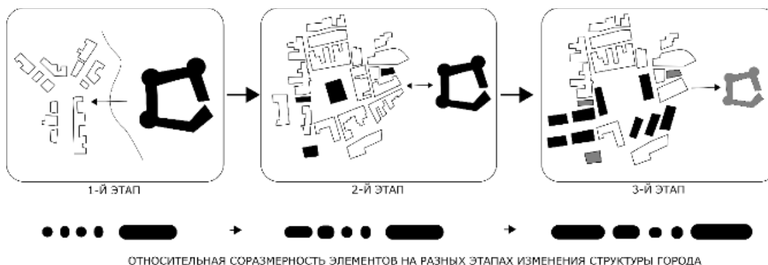
ОТНОСИТЕЛЬНАЯ СОРАЗМЕРНОСТЬ ЭЛЕМЕНТОВ НА РАЗНЫХ ЭТАПАХ ИЗМЕНЕНИЯ СТРУКТУРЫ ГОРОДА Рисунок 3. Этапы развития морфологической структуры, с отображением соразмерности архитектурных объектов относительно типологических групп (разработка автора).

городской структуры второй половины XX ст. (3-й этап), (Рисунок 3).