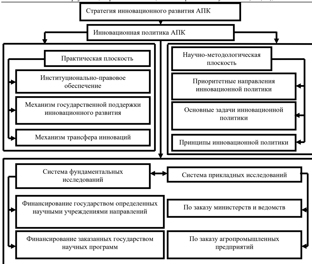
Рис. 2. Элементы политики инновационного развития агропромышленных формирований [3]

Эта политика должна носить постоянный потоковый характер и соответствовать приоритетным принципам и задачам долгосрочного развития молокоперерабатывающей промышленности в целом и экономическим интересам отдельных субъектов этой отрасли. Среди основных принципов инновационного развития молокоперерабатывающих предприятий можно выделить следующие: приоритетность инновационных преобразований отрасли с целью обеспечения продовольственной безопасности страны и сохранения здоровья нации; повышение уровня интенсивности инновационного развития; наращивание и активизация инновационного потенциала отрасли; государственная поддержка инновационного развития молокоперерабатывающих предприятий; коммерческий характер инновационных разработок; активизация международного сотрудничества; экологичность и безопасность продуктов питания; согласования интересов всех субъектов экономических отношений в АПК; непрерывный поточный характер осуществления.