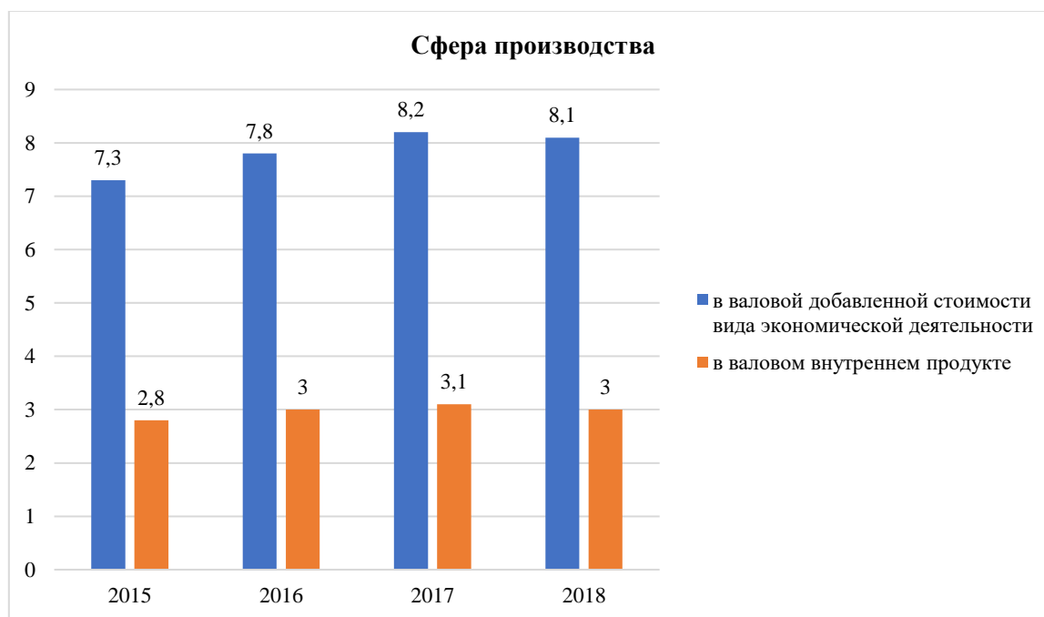
Рисунок 1.1 – Динамика теневой экономики в сфере производства в Республике Беларусь (в процентах) за 2015-2018 гг.

Показатели производственной деятельности институциональных секторов позволяют получить представление о функционировании экономики в целом.