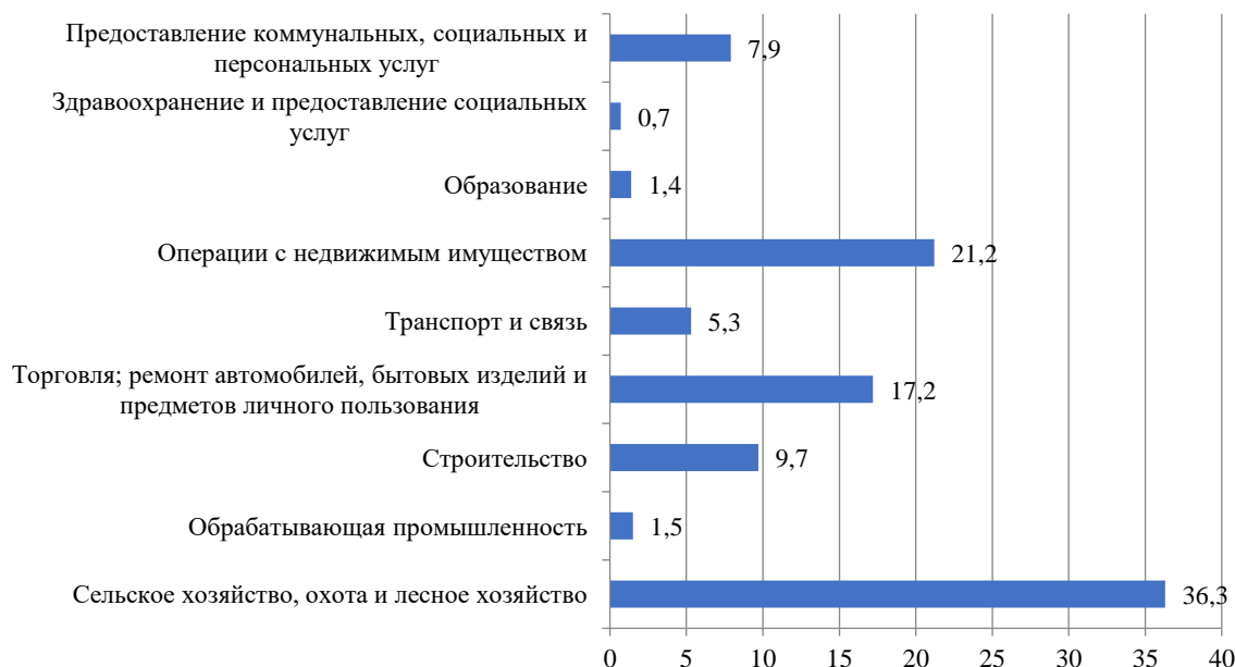
Рисунок 1.4 – Удельный вес ненаблюдаемой экономики в валовой добавленной стоимости в текущих ценах по видам экономической деятельности по оценке за 2011 год (в процентах)

Ненаблюдаемая экономика проникает в те сферы деятельности, где по естественным причинам трудно контролировать операционную или финансовую деятельность. Рассмотрим изменения теневой экономики в сфере производства и услуг, перейдем к анализу удельного веса ННЭ по видам экономической деятельности (рисунок 1.4 и 1.5).