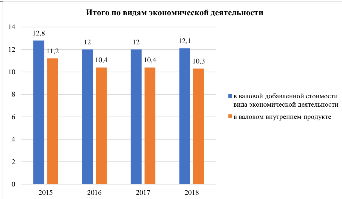
Рисунок 1.3 – Динамика теневой экономики в Республике Беларусь (в процентах) за 2015-2018 гг.

Примечание – Источник: составлен по [5;6].