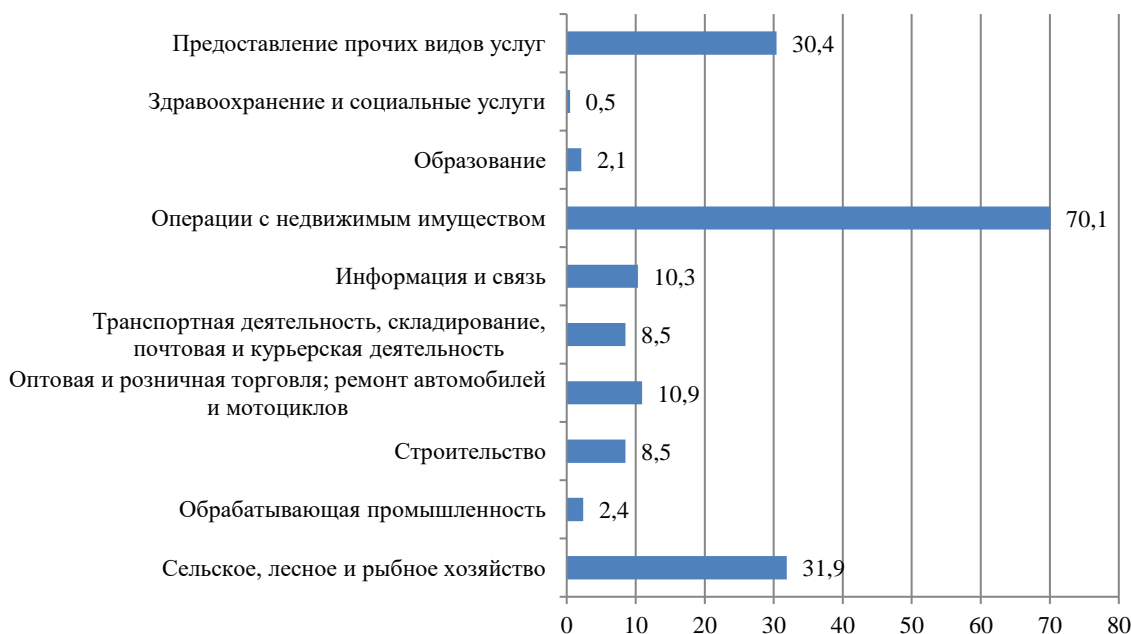
Рисунок 1.5 – Удельный вес ненаблюдаемой экономики в валовой добавленной стоимости в текущих ценах по видам экономической деятельности по оценке за 2018 год (в процентах)

На третьем месте – сфера торговли, ремонта автомобилей, бытовых изделий и предметов личного пользования (17,2% от ВДС).