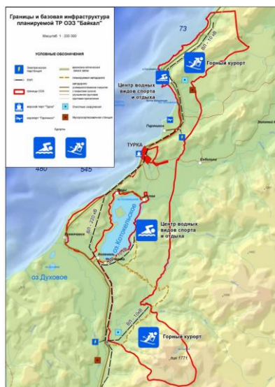
Рис. 2. Схема размещения ОАЗ ТРТ «Байкальская гавань» [11]