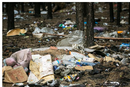
Рис. 5. Несанкционированные свалки в лесу Прибайкальского района [23]

На уборку несанкционированных свалок на побережье оз. Байкала и оз. Котокель направляются волонтеры, участвующие в различных экологических акциях. Вместе с тем, уборка мусора силами волонтеров проблему не решает, поскольку