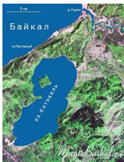
Рис. 1. Озеро Котокель (вид со спутника) [29]

Экологическая катастрофа, случившаяся всего в 2 км от участка всемирного наследия — оз. Байкал и в границах особой экономической зоны туристско-рекреационного типа «Байкальская гавань» (далее — ОЭЗ ТРТ «Байкальская гавань») (см. рис. 2) стала основной проблемой для всех причастных в следствие возможного проникновения заражённых вод и переносчика болезни из оз. Котокель через систему рек Исток — Коточик — Турка в оз. Байкал [47].