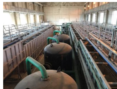
Рис. 3. Очистные сооружения ОЭЗ ТРТ «Байкальская гавань» [3]

Дополнительно на озеро воздействуют местные жители и обслуживающий персонал, проживающий на туристско-рекреационных объектах постоянно или в период их функционирования [9]. Все туристско-рекреационные объекты прилегают к населённым пунктам Котокель, Черемушки, Ярцы, Исток. На 01.01.2013 г. общая численность населения составила 438 чел. [45]. В населённых пунктах Прикотокелья нет централизованной хозяйственно-бытовой канализации с устройством очистных сооружений. Обеспеченность населения централизованным водоотведением по району составляет 36,6 % [53].