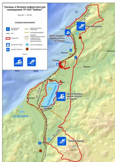
Рис. 2. Схема размещения ОЭЗ ТРТ «Байкальская гавань» [11]

«Биопродуктивность эвтрофных озёр Иркана и Котокель бассейна оз. Байкал» [6]. Результаты последних комплексных исследований, проведённых в 2008–2009 гг., представлены в монографии «Озеро Котокельское: природные условия, биота, экология», ответственные редакторы — д.б.н., профессор Н. М. Пронин и д.б.н., профессор Л. Л. Убугунов [32].