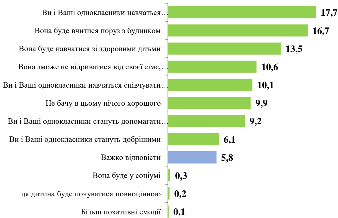
Рис. 2.5. Позитивні сторони інклюзивної освіти в загальноосвітній школі