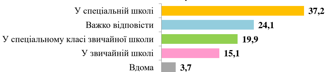
Рис. 2.4. Ставлення учнів щодо місця навчання дітей з обмеженими можливостями здоров'я