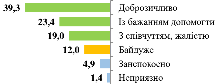
Рис. 2.3. Ставлення учнів до людей з обмеженими можливостями здоров'я

Освітні програми дають змогу дитині із вадами взаємодіяти зі звичайними дітьми, спостерігати за ними, наслідувати їх. Інакше кажучи, учні з особливими потребами можуть отримувати такий же соціальний досвід, як і їхні здорові товариші. Перебування у класі зі здоровими ровесниками дає дитині з вадами можливість розвивати відповідні її віку комунікативні та соціальні навички.