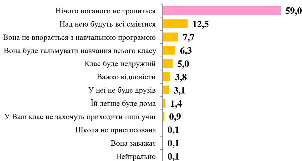
Рис. 2.6. Негативні сторони інклюзивної освіти в загальноосвітній школі

Отже діти з особливими потребами, залучені до звичайного життя, стають повноцінними членами соціуму і часто вже не лише не потребують підтримки громади, а й, навпаки, роблять свій внесок у загальну справу.