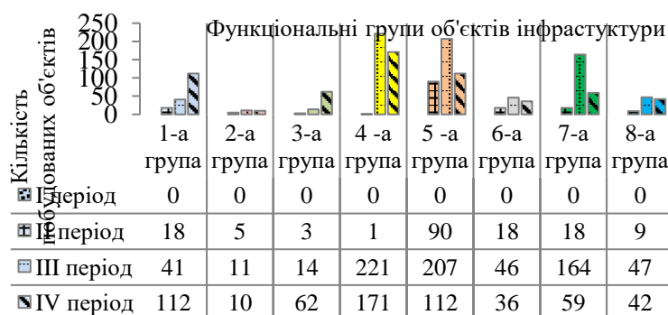
Діаграма 1. Динаміка створення інфраструктури у 1-4 округах (округ кірасирської дивізії) Українського військового поселення у 1817 – 1857 рр.

З 1846-1847 років щорічні суми на будівництво та ремонт стають фіксованими. За кошти загального капіталу військових поселень будуються тільки капітальні кам'яні будівлі та оновлюються застарілі дерев'яні, плотові чи фахверкові. Тому для будівництва необхідних об'єктів місцевому керівництву дозволяють витратити кошти з капіталу військових поселень [19, арк. 1–15]. Ознакою часу стає зведення у всіх без виключення населених пунктах поселення протягом 1-2-х років таких однотипних об'єктів, як лазні для дотримання гігієни, будинки на кладовищах для уявно померлих, будівлі для розміщення пожежної команди, коней та інструментів тощо.