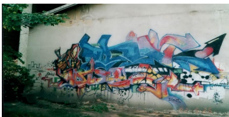
Рис. 5. Граффити «writing», в стиле «wildstyle», г. Ивано-Франковск

особенного распространения получил в начале XXI в. Среда города насчитывала много интересных работ, выполненных на достойном уровне. Например, «writing», выполненный в стиле «wildstyle» на стене нежилого района города командой (объединением нескольких райтеров) ESKA, отличается сложностью рисунка, которой достигнуто с помощью многократно переплетающихся букв необычной формы, создающих декоративное панно, при этом исключая возможность считывания текста. Граффити дополнительно украшено большим количеством мелких элементов в форме стрелок, а также стилизованным изображением райтера с баллончиком краски (рис.5).