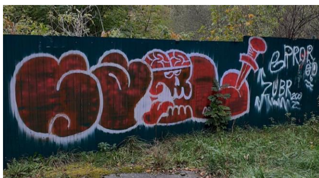
Рис. 2. Граффити «bombing», в стиле «bubble letters» г. Яремче

традиционную форму букв, что, в свою очередь, обеспечивает их читаемость, однако не лишает декоративности и неожиданных сюжетных решений (рис.3).