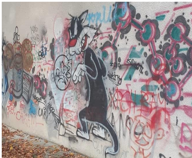
Рис. 4. Граффити «cartoon», г. Ивано-Франковск

черты андеграундной и массовой культур, благодаря чему становится более понятным широкому кругу зрителей (рис.4).