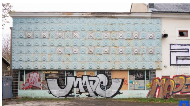
Рис. 1. Граффити «bombing», в стиле «throw-up» г. Коломыя

субкультурного граффити как «bombing», заключающийся в максимально быстром выполнении рисунка на хорошо видимом месте. Если когда-то с помощью этой техники разрисовывались, в основном, вагоны поездов, то сегодня bombing вышел на улицы городов и активно распространяется на архитектурных фасадах. Его характеризует низкая детализация графики, однако художественная вольность и динамичность форм. Образцы этого вида граффити находим практически в каждом городе области. Например, в г. Коломые видим рисунки в стиле «throw-up», выполненные в двух-трех цветах, без дополнительных эффектов или декоративных элементов (рис.1).