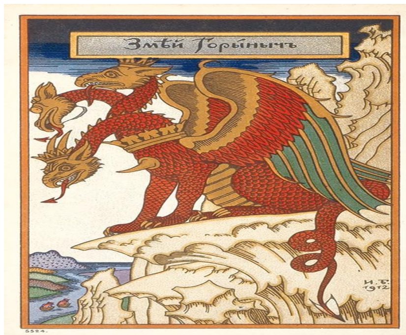
Рис. 1 Художник Иван Билибин «Змей Горыныч»

Художник Иван Билибин [8] в 1912 году следующим образом представил Змея Горыныча (рис. 1) [9]