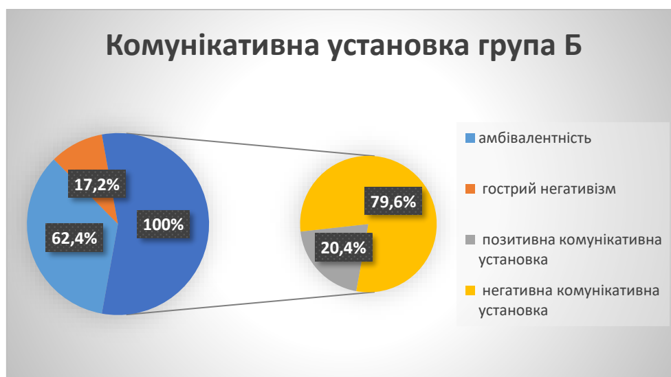
Рис.1 Комунікативна установка публічних службовців. Категорія Б.

Протягом 2017-2019 років у дослідженні брали участь публічні службовці категорій Б і В, загальною кількістю 376 осіб, працівники центральних органів виконавчої влади та місцевого самоврядування. Узагальнені результати соціально-психологічного дослідження, за допомогою методики діагностики комунікативної установки В. Бойка, констатують загальну негативну комунікативну установку (у межах 75%) опитаних публічних службовців (див. рис. 1, рис. 2). Як видно з рис. 1 та рис. 2, тільки 20-25% опитаних демонструють позитивну готовність до комунікації у професійній діяльності, а 16-17,2% опитаних демонструють гострий негативізм до налагодження взаємостосунків (у більшості це публічні службовці категорії Б). Загальною характеристикою емоційного фактору є амбівалентність (у межах 75-80%), тобто внутрішні протиріччя, невизначеність, незадоволеність, стагнація, негативне групомислення.