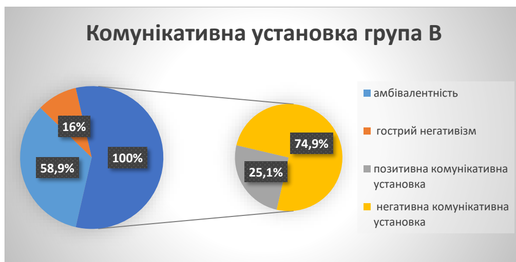
Рис.2 Комунікативна установка публічних службовців. Категорія В.