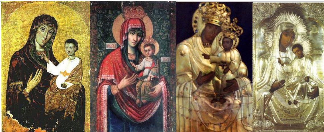
ил.10 ил.11 ил.12 ил.13

Висновки та пропозиції. В процесі атрибуції зіставлялися технологічні прийоми і технічні засоби іконописця, отримані в результаті мікроскопічних досліджень, аналізу фактури фарбового шару а також вивченні живопису під впливом інфрачервоного і ультрафіолетового випромінювань. Отримані дані не суперечать даті вказаній в автентичному написі розташованому в дробівниці знизу середника ікони – 1729 рік.