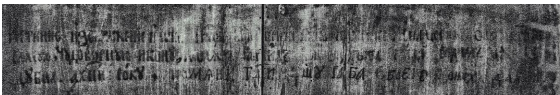
(іл.4) Фото в ІЧ променях чорнильного напису на звороті

Чернігівської ікони Божої Матері написаної в 1658 році Григорієм Дубенським, та згадування про автора списку – ченця Далмата Печерського (іл.4).