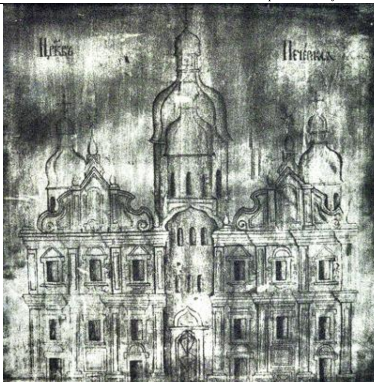
(іл.5) Фото в ІЧ променях чорнильного малюнку на звороті дошки із зображенням Успенського собору Києво-Печерської Лаври.

По середині тильної частини дошки розташований чорнильний малюнок із зображенням Успенського собору Києво-Печерської Лаври (іл.5).