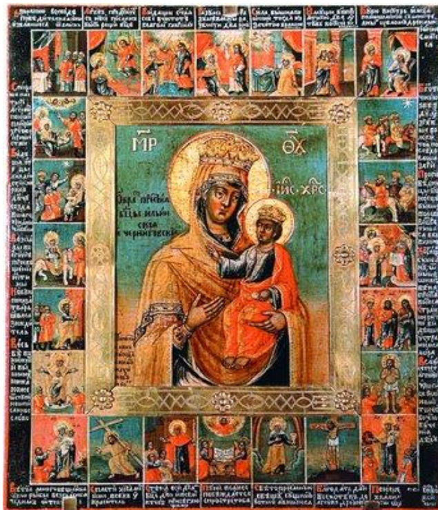
(іл.9) Яким Максимов. Ікона Божої Матері «Чернігівської Іллінської» з акафістом, 1780 р.; дерево, темпера. Володимиро-Суздальський музей-заповідник.

також кипарису. Зображення на нижньому полі при загальній відповідності композиційної побудови кіотної рами змінено. Якщо на рамі в центрі був зображений герб гетьмана Мазепи, а по боках від нього - військовий табір під місяцем і місто, освітлене сонцем, то на іконах складного ізводу в центрі нижнього поля представлений російський герб із зображенням Азовської ікони Божої Матері, зліва – план військових дій при Азові, праворуч – освітлений сонцем вид Троїцько-Іллінського монастиря з хресним ходом.