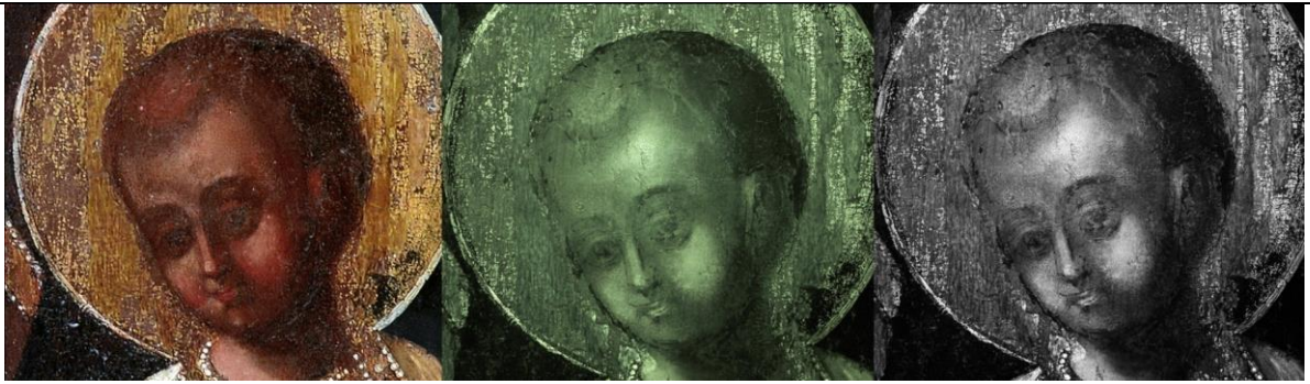
(іл.2) Фото фрагменту лику Христа в ІЧ променях

Тло живописного поля ікони – темно-оливкове; традиційні поля відсутні, середник обрамлений тонким чорним опушом.