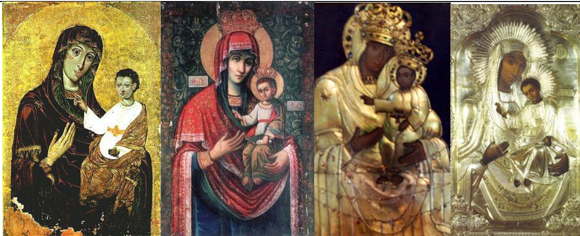
іл.10 іл.11 іл.12 іл.13

Висновки та пропозиції. В процесі атрибуції зіставлялися технологічні прийоми і технічні засоби іконописця, отримані в результаті мікроскопічних досліджень, аналізу фактури фарбового шару а також вивченні живопису під впливом інфрачервоного і ультрафіолетового випромінювань. Отримані дані не суперечать даті вказаній в автентичному написі розташованому в дробівниці знизу середника ікони – 1729 рік.