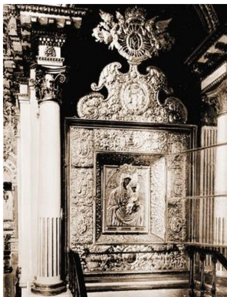
(іл.8) Срібна шата ікони Богородиці «Троїцько-Іллінської», виконана на замовлення гетьмана Івана Мазепи в 1696 р. (фото 1880-тих років)

Вірогідно, ця гравюра стала основним зразком для іконописців, причому на таких списках зазвичай повторювався ідентифікуючий напис знизу, як на досліджуваній пам'ятці.