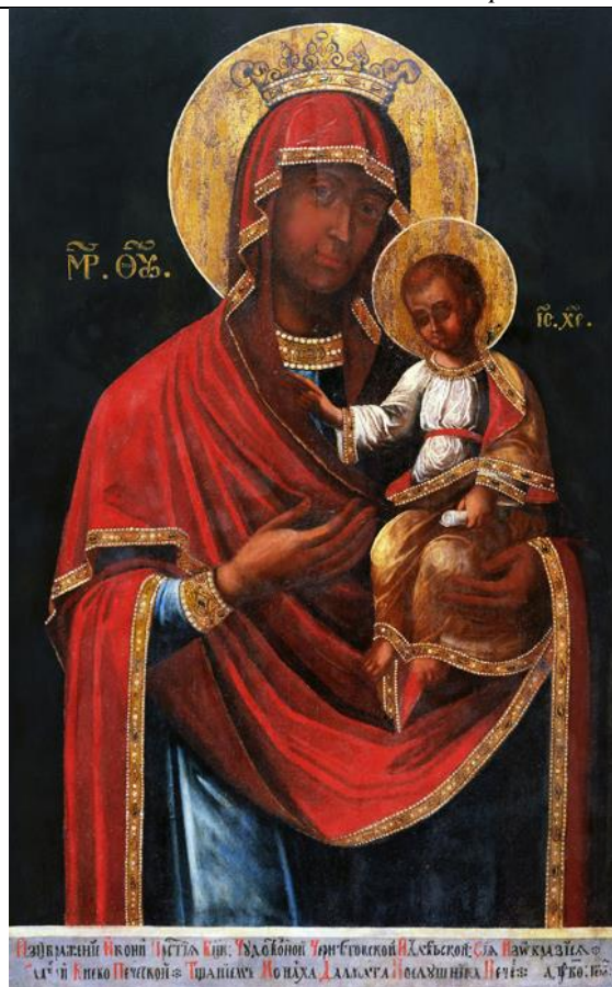
(іл. 1) Далмат Печерський. Ікона Божої Матері «Чернігівської Іллінської», 1729 р.; дерево, олія; 93х57 см. Приватна колекція. Київ.

Цікавим і рідкісним прикладом підписної та точно датованої пам'ятки є ікона Пресвятої Богородиці «Чернігівської Іллінської» 1729 року, пензля ченця Києво-Печерської Лаври - Далмата Печерського, що походить з приватної київської колекції.