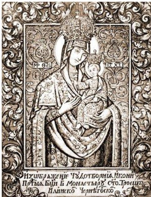
(іл.7) Гравюра з книги Свт. Димитрія Ростовського «Руно орошенное». Чернігів, 1683 р.

зображення Богородиці «Чернігівської Іллінської», серед них - ксилографія, виконана в Києво-Печерській лаврі; різцева гравюра 1727 року роботи монаха Гавриїла на замовлення ієромонаха Ірінарха (Бугушевича), де Богородиця і Немовля представлені в рамці з квітів і акантового листя.