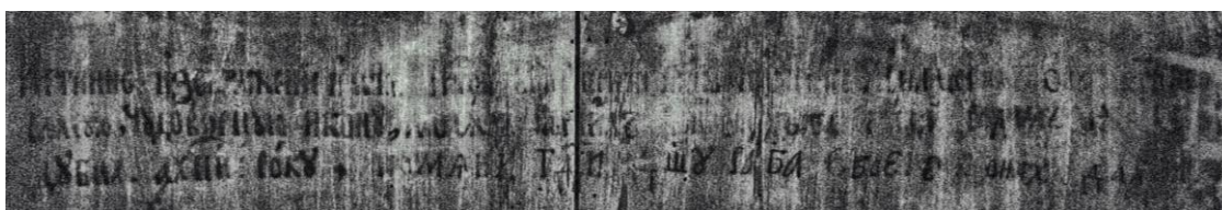
(іл.4) Фото в ІЧ променях чорнильного напису на звороті

Чернігівської ікони Божої Матері написаної в 1658 році Григорієм Дубенським, та згадування про автора списку – ченця Далмата Печерського (іл.4).