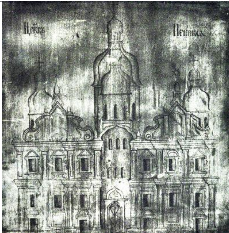
(іл.5) Фото в ІЧ променях чорнильного малюнку на звороті дошки із зображенням Успенського собору Києво-Печерської Лаври.

По середині тильної частини дошки розташований чорнильний малюнок із зображенням Успенського собору Києво-Печерської Лаври (іл.5).