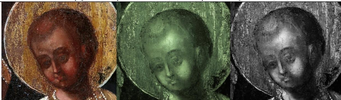
(іл.2) Фото фрагменту лику Христа в ІЧ променях

Тло живописного поля ікони – темно-оливкове; традиційні поля відсутні, середник обрамлений тонким чорним опушом.