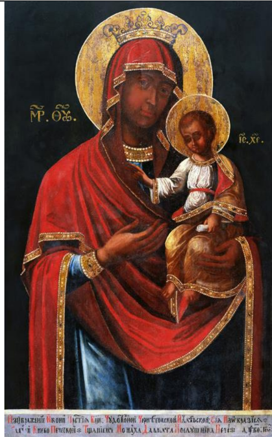
(іл. 1) Далмат Печерський. Ікона Божої Матері «Чернігівської Іллінської», 1729 р.; дерево, олія; 93х57 см. Приватна колекція. Київ.

Цікавим і рідкісним прикладом підписної та точно датованої пам'ятки є ікона Пресвятої Богородиці «Чернігівської Іллінської» 1729 року, пензля ченця Києво-Печерської Лаври - Далмата Печерського, що походить з приватної київської колекції.