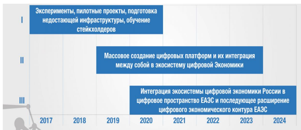
Рисунок 1. Этапы формирования цифровой экономики в России

Цифровые технологии оказывают осязаемое влияние на все сферы жизнедеятельности в рамках ЕАЭС, где интегрируются цифровые процессы, средства цифрового взаимодействия, информационные ресурсы, а также совокупность цифровых инфраструктур, на основе норм регулирования, механизмов организации, управления и использования (рис.1). Основным направлением построения цифровой экономики является полная интеграция российской виртуальной экономики со сферой ЕАЭС. Государство обязуется создать все технические и финансовые условия для скорейшего прогресса новой финансовой отрасли.